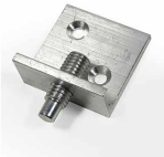
Système de suspension