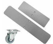
Pieds plats avec ou sans roues