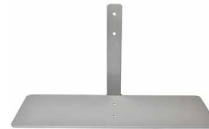
Pied de support latéral